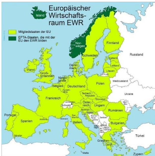
Ergänzte Grafik von © www.europarl.europa.eu

Es soll einen Überblick über das deutsche Besteuerungsverfahren bei der Versicherungs- und der Feuerschutzsteuer geben.